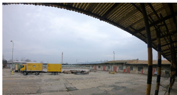
Budova „700/1 – Sklad a výdej olejů“