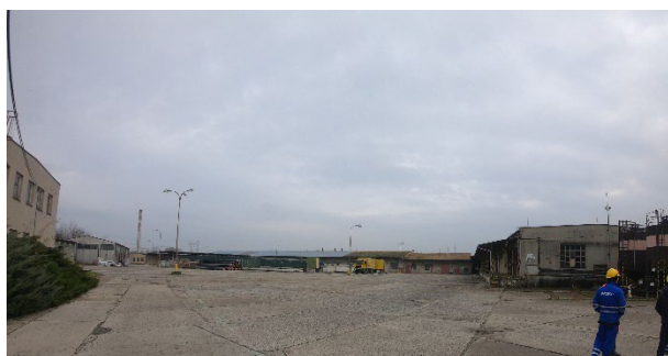
Budova „700/1 – Sklad a výdej olejů“

Předmětem technické zprávy je instalace nové fotovoltaické elektrárny s označením FVE 1 o výkonu 124,44 kWp na jižní střeše budovy označené jako „ 700/1- Sklad a výdej olejů “ (p. č. st. 216, bez č. p.). Tato technická zpráva řeší instalaci samotného fotovoltaického zdroje elektřiny – střídavá (AC) a stejnosměrná (DC) část. Panely budou uloženy na speciální hliníkové konstrukci se sklonem kopírující sklon střechy a budou mít orientaci na jih. Součástí panelů budou optimizéry. Součástí projektu je také rozvaděč stejnosměrné části označený jako RDC 1 a rozvaděč střídavé části označený jako RAC 1. Dále střídače, napojení střídačů, kabelové rozvody a příprava napojení rozvaděčů pro vyvedení elektřiny z nově instalované FVE 1 tak, aby byla zajištěna její efektivní distribuce do vnitroareálových rozvodů v areálu společnosti ČEPRO, a.s. – Mstětice.