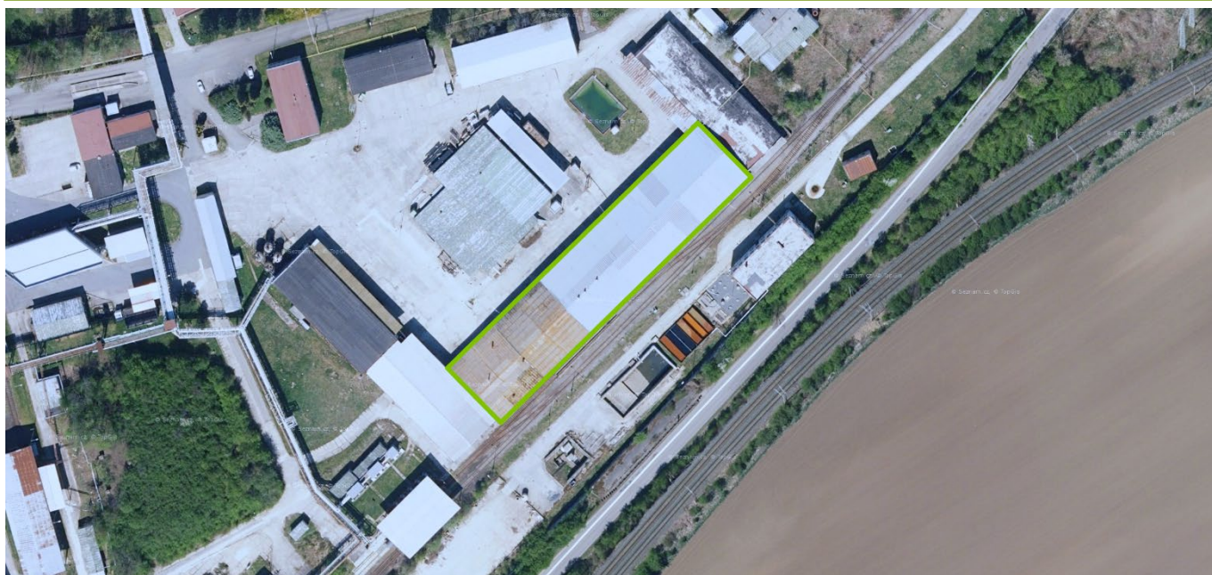
Vyznačená budova „700/1 – Sklad a výdej olejů“